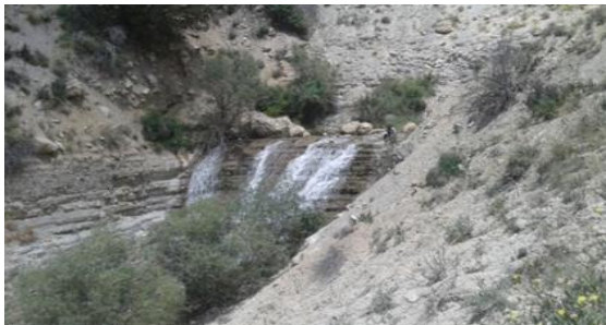
شکل ۳. آبشار دهنه حیدری در بستر رودخانه اندرآب

پناهگاه حیات وحش حیدری با ۷۰ کیلومتر فاصله در شمال و شمال‌غربی شهرستان نیشابور، در مرز با شهرستان‌های قوچان و چناران قرار گرفته است. مسیر دسترسی به پناهگاه حیدری از نیشابور، به سمت شمال بعد از گذر از روستای اندرآب، نصیرآباد، دهنه حیدری (شکل ۳) و همچنین شهر جدید فیروز و معدن سنگ فیروز می‌باشد. پناهگاه حیات وحش حیدری منطقه‌ای است کوهستانی با پوشش گیاهی مناسب و با تپه ماهورهای منفرد و دره‌های نسبتاً عمیق که یکی از بهترین زیستگاه‌های جانوری خصوصاً قوچ و میش و گراز می‌باشد. پوشش درختی غالب منطقه از گونه‌ای سوزنی برگ بومی از خانواده سروها به نام "ارس" است که عمر اغلب آنها بیش از هزار سال است. اشکال مختلف ژئومورفولوژیکی در منطقه در کنار سایر جاذبه موجود منطقه ویژه‌ای را از نظر گردشگری بوجود آورده است (شکل ۴).