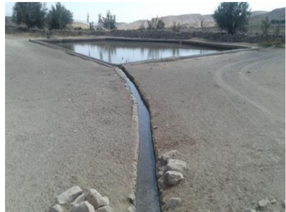
شکل ۹. قنات‌های پلکانی روستای سرچاه،

قنات‌های روستای سرچاه که در حدود ۱۰ قنات دایر و بیش از ۶ قنات مخروبه وجود دارد در شیب دره‌های کوهستانی بصورت پلکانی ایجاد شده‌اند که نفوذ آب در بخش زمین‌های کشاورزی می‌تواند بلافاصله جذب مادر چاه‌های قنات پایین دست خود شود و مهمترین تأمین کننده آب این منطقه می‌باشد (شکل ۹).