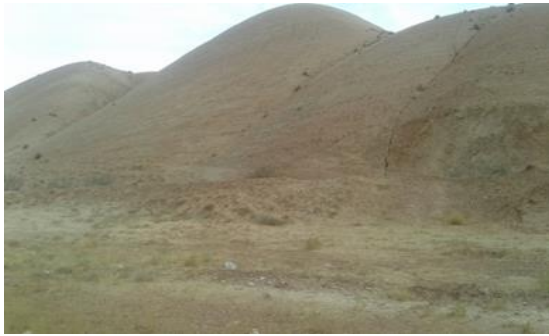
شکل ۶. گنبدهای نمکی روستای وزیری