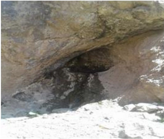
شکل ۱۰. چشمه کاسه‌ای کوه‌های برزنون