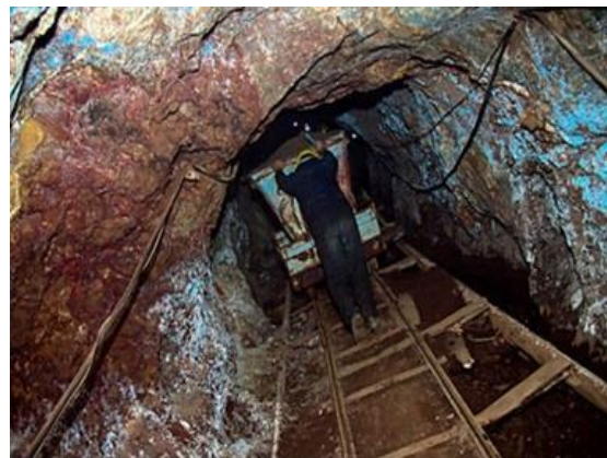
شکل ۲. معدن فیروزه روستای کان فیروزه.

قدیمی‌ترین فیروزه‌ای که تاکنون در دشت نیشابور کشف شده، در منطقه تپه برج ۶۶۰۰ سال قدمت تاریخی دارد. در نتیجه قدمت معدن نیشابوری به صورت مستند نزدیک به ۷ هزار سال می‌رسد و به این ترتیب قدیمی‌ترین معدن فیروزه جهان قلمداد می‌شود (شکل ۲). این معدن از نظر میزان تولید نیز بزرگ‌ترین معدن فیروزه و نیز قدیمی‌ترین معدن فعال جهان است. این معدن در تمام این ۷ هزار سال فعال بوده و مرتب از آن استخراج می‌شده است. با ارزیابی ذخیره‌ای که انجام شده، گفته می‌شود این معدن تا ۲۰۰ سال دیگر قابل استخراج باشد. از سال ۱۳۸۲ این معدن توسط شرکت تعاونی شهر فیروزه، متشکل از ۳۴۲ عضو از وزارت صنعت و معدن به مدت ۲۵ سال اجاره شد.