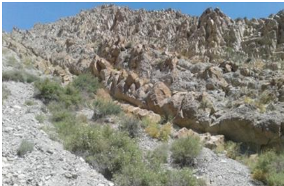
شکل ۷. ساختمان‌های چین و گسل خورده در آهک سازند

در مسیر روستای قرونه به سمت روستای بقیع بعد از باغ‌ها و نرسیده به حصار قلعه سنگ‌های درشت و ریز به صورت مکعبی از دامنه بلندی به پایین و داخل دره فرو ریخته‌اند که اهالی توجهی به آنها نداشتند و بعضا بعد از سیراب کردن گوسفندان در رودخانه در زیر سایه درختان پراکنده محلی گوسفندان را روی این سنگ‌ها می‌خوابانند. برخی از سنگ‌های این منطقه که شکسته‌اند فسیل داخل آنها نمایان است. شکل (۷) سازندهای چین و گسل خورده در آهک سازند لار را نشان می‌دهد.