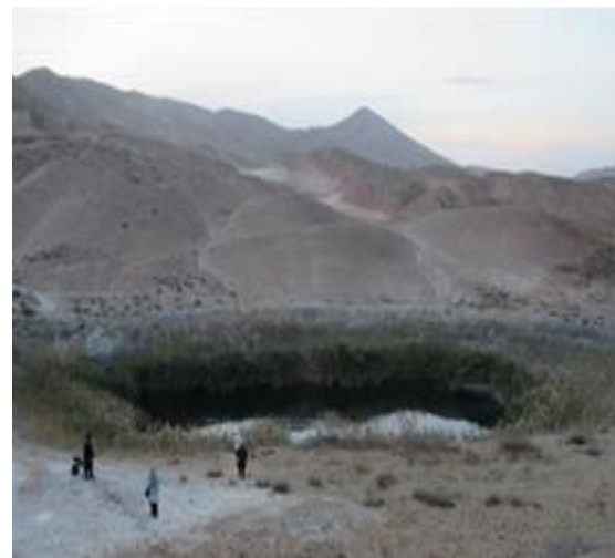
شکل ۵. اشکال شبه کارست در سازند تبخیر روستای زرنده

در سه کیلومتری غرب روستای زرنده از دهستان بینالود، قلّه زیبایی به نام سی سر به ارتفاع ۱۷۵۵ متر وجود دارد. این کوه که از کوه‌های اطراف بلندتر است. این کوه از قسمت‌های مختلفی تشکیل شده است و شبیه به گوستا است صخره‌های آن بسیار جذاب و زیباست. در فاصله ۱۷۰۰ متری جنوب روستای زرنده نیز دریاچه‌های سه‌گانه سی سر واقع شده است که پس از دریاچه بزنگان سرخس دومین آبگیر طبیعی استان خراسان رضوی است که آب آن از طریق چشمه‌های زیرزمینی و آب‌های سطحی ناشی از باران‌های بهاری تامین می‌گردد (شکل ۵).