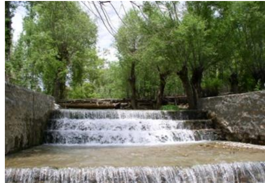
شکل ۸. مناظر طبیعی روستای بقیع

زیبایی را به وجود آورده است که بازدیدکنندگان را به خود جذب می‌نماید. وجود باغات همچنین به سرسبزی بیشتر منطقه و اعتدال آب و هوا نیز کمک کرده است (شکل ۸).