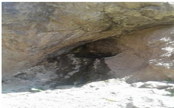
شکل ۴. چشمه کاسه‌ای کوه‌های برزنون، منبع: نگارندگان، ۱۳۹۸

محدوده حفاظت شده دهنه‌حیدری (پناهگاه حیات وحش) امکان هرگونه بهره‌برداری از معادن را در منطقه مذکور ممنوع نموده است و هیچ‌گونه مطالعه‌ای در این زمینه از طرف اداره معادن انجام نشده است. معادن فلدسپات و کائولن مهمترین معادن شناخته شده در روستای سرچاه می‌باشد که هنوز بهره‌برداری از آنها شروع نشده است (سعادت‌فر، ۱۳۸۷: ۸۹). معادن سرب و روی جدیداً در شمال‌شرق روستای دامنجان بصورت غیردولتی در حال بهره‌برداری است.