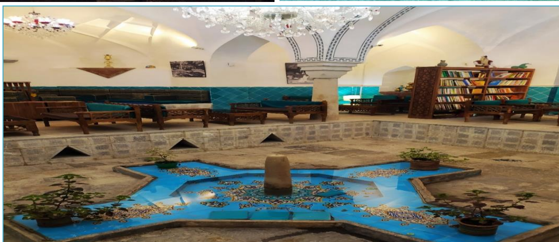
شکل ۲. نمادهای گردشگری شهر خرم آباد.

۱۳ نفر معادل ۳۶/۱ درصد مرد و تعداد ۲۳ نفر معادل ۶۳/۹