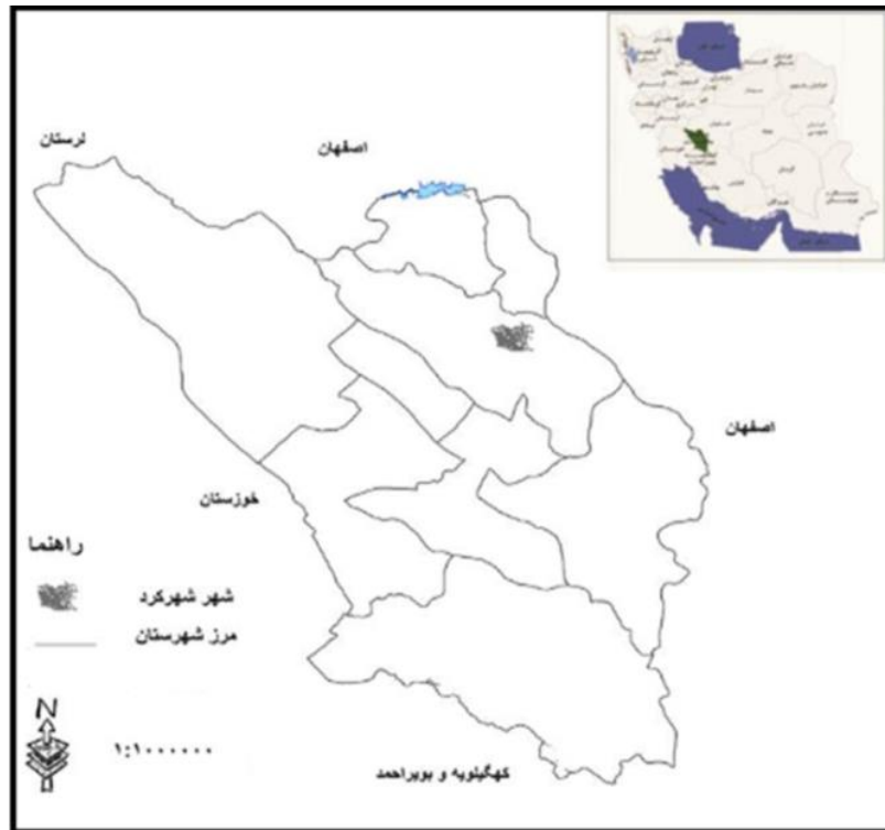
شکل ۱. موقعیت محدوده مورد مطالعه، منبع: نگارندگان، ۱۴۰۰