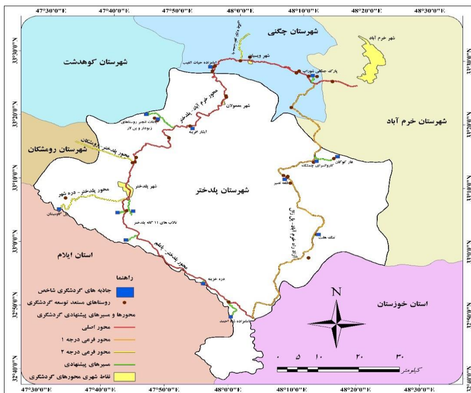
شکل ۳. اولویت‌بندی محورها و مسیرهای پیشنهادی گردشگری در محدوده مورد مطالعه.

شهرستان پل‌دختر می‌شود. محور خرم زال به عنوان محور فرعی درجه ۱، از محدوده شهرستان خرم‌آباد، چگنی و پل‌دختر عبور می‌نماید، اما بخش عمده آن در شهرستان پل‌دختر واقع شده است. محورهای فرعی درجه ۲ متصل به محور خرم‌آباد - پل‌دختر شامل مسیر فرعی چم دیوان - سراب دوره، پل‌دختر - رومشکان و پل‌دختر - دره شهر می‌باشند. از مسیرهای پیشنهادی دارای پتانسیل گردشگری در محور اصلی خرم‌آباد - پل‌دختر می‌توان به محورهای منتهی به پارک جنگلی شوراب (روستای شوراب گردنه)، امامزاده حیات الغیب (روستای حیات‌الغیب)، روستاهای