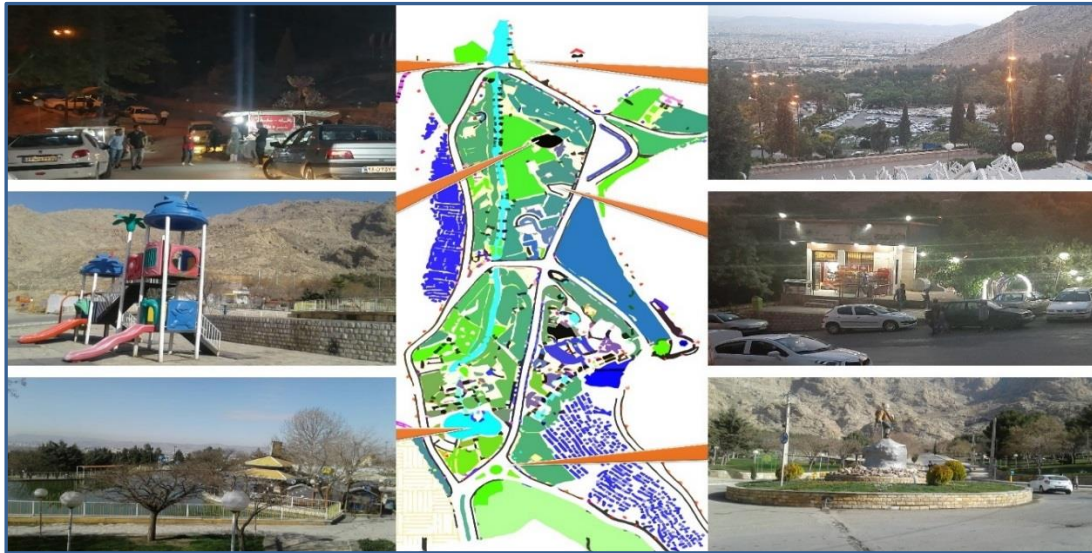
شکل ۲. تصاویری از مجموعه فضاهای پارک کوهستان شهر کرمانشاه، منبع: نگارندگان، ۱۴۰۰