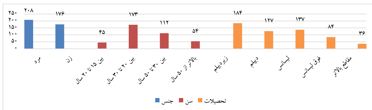
شکل ۲. مشخصات جمعیتی

در جهت تحلیل یافته‌ها توصیفی پژوهش، در ابتدا به