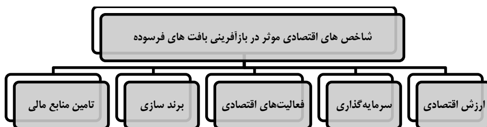
شکل ۲. دیاگرام عملیات ارزیابی در سیستم تحلیل سلسله‌مراتبی

ضروری است. بر این اساس کار ارزیابی سطوح، با محاسبه وزن (ضریب) اهمیت معیارها آغاز می‌گردد. شکل (۲) دیاگرام عملیات ارزیابی در سیستم تحلیل سلسله‌مراتبی را نشان می‌دهد.