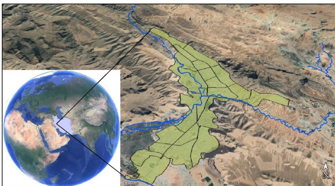
شکل ۱. نواحی ۲۴ گانه شهر خرم‌آباد و موقعیت رودخانه‌های اصلی

شهر خرم‌آباد مرکز استان لرستان در جنوبی غربی کشور واقع گردیده است. خرم‌آباد شهری کوهستانی-دره‌ای، که در دو طرف بستر رودخانه خرم رود (شمالی-جنوبی) توسعه یافته است و شهر در دو قسمت نابرابر شرقی-غربی گسترش یافته و ساخته شده است. قسمت جنوبی شهر چشم‌اندازی تقریباً جلگه‌ای و شمال آن منظره‌ای کوهستانی و ناهموار دارد. شکل‌گیری کالبد شهر خرم-آباد متأثر از ویژگی‌های طبیعت منطقه است، هرجایی که دره