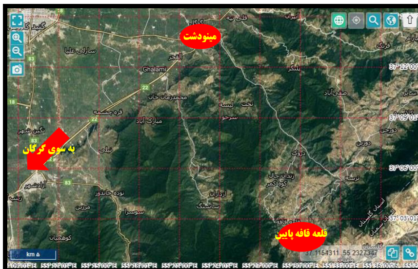
شکل ۱. موقعیت روستای قلعه قافه پایین نسبت به شهرستان مینودشت، منبع: نگارنده، ۱۳۹۹

روستای قلعه قافه پایین دارای طرح هادی است و در چند سال گذشته قسمتی از معابر اصلی روستا با سنگفرش اجرا شده اند. اما دفع پساب و رواناب و فاضلاب یکی از مسائل و مشکلات معابر روستای قلعه قافه پایین به شمار می رود. کوهستانی بودن روستا و بافت ارگانیک، هزینه زیاد تخریب و عدم بودجه کافی از جمله مواردی هستند که تا کنون