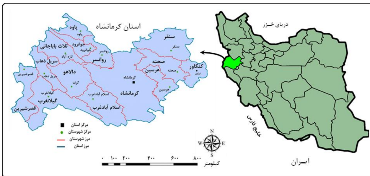
شکل ۲. موقعیت جغرافیایی محدوده مورد مطالعه، منبع: نگارندگان، ۱۴۰۰

استان کرمانشاه با مساحت ۲۴۶۴۰ کیلومتر مربع، هفدهمین استان ایران از نظر وسعت به‌شمار می‌رود. این استان که ۱/۵ درصد مساحت کشور را دربر می‌گیرد از استان‌های غربی کشور به‌شمار می‌آید که با کشور عراق مرز مشترک دارند (شکل ۲). همچنین استان کرمانشاه از شمال به استان