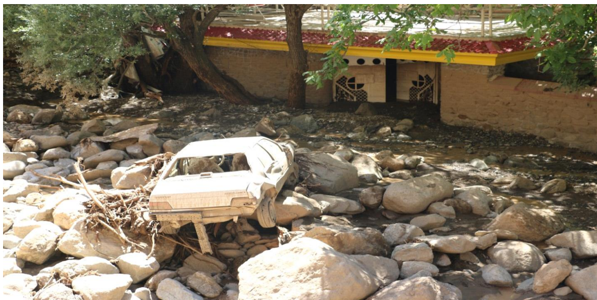
شکل ۳. نمایی از تخریب منازل مسکونی و اتومبیل در سیل سیجان، منبع: اداره کل منابع طبیعی و آبخیزداری، ۱۳۹۴