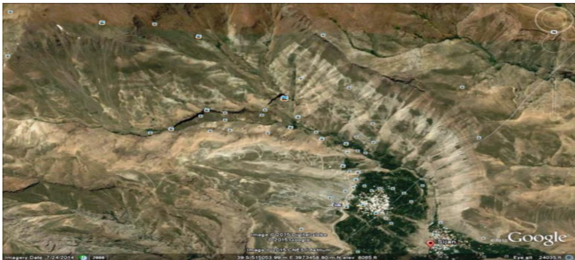
شکل ۲. محدوده وقوع سیل در روستای سیجان، منبع: اداره کل منابع طبیعی و آبخیزداری، ۱۳۹۴

الف: تلفات انسانی به تعداد ۸ نفر که اجساد آنها شناسایی گردیده و زخمی و مجروح شدن بیش از ۱۲۰ نفر در سطح روستا؛ ب: خسارت عمده به خودروهای موجود در مسیر سیلاب که حدود ۱۰۲ دستگاه خودرو در جریان این سیل گرفتار و بطور کامل متلاشی گردیده اند و برخی خودروها تا مسافتهای چند کیلومتری توسط سیلاب حمل شده اند. پ: خسارت عمده به خطوط انتقال برق و آب در داخل روستا و قطع آب و برق؛ ت: خسارت عمده به راه دسترسی و معابر داخل روستا و ورود سیلاب به داخل منازل و بروز مشکلات؛