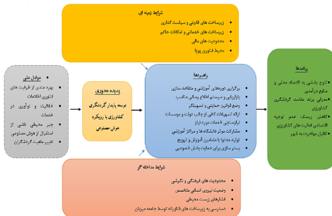
شکل شماره ۱. مدل اولیه کدگذاری محوری نتایج (یافته‌های پژوهش)

است ضمن اولویت‌بندی این عوامل نسبت به تدوین سیاست مناسب اقدام کرد. در این قسمت با استفاده از روش مقایسات زوجی که معتبرترین روش رتبه‌بندی به شمار می‌رود نسبت به رتبه‌بندی ۲۴ عامل اصلی اقدام می‌شود. براین این منظور پرسشنامه شامل جدول دوتایی ۲۴ تایی طراحی و در اختیار کارشناسان مربوطه قرار گرفت و با استفاده از روش AHP و بکارگیری نرم افزار 11 expert choice این جداول مورد