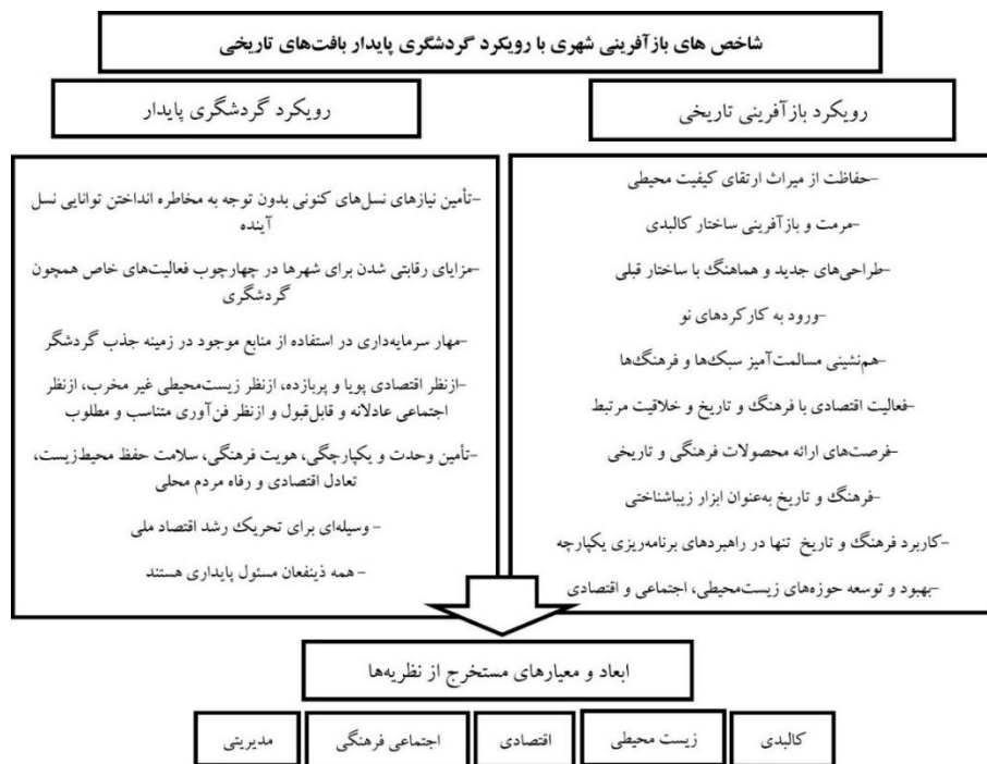
شکل ۱. مدل نظری پژوهش

به طور کلی، امروزه یکی از چالش‌های اساسی شهرهای ایران، فقدان هماهنگی میان ارکان نظام برنامه‌ریزی شهری است. اقدامات بخشی نهادها، تداخل وظایف، و غیبت رویکردی جامع در برنامه‌ریزی، منجر به ناکارآمدی‌های گسترده در ابعاد کالبدی، اجتماعی، اقتصادی و زیست‌محیطی شهرها شده است. این ناکارآمدی‌ها، در شرایطی که با محدودیت منابع و زمان نیز مواجه هستیم، پیامدهایی پرخطر برای آینده شهرها به همراه دارد؛ مگر آنکه تغییرات بنیادینی در رویه‌ها و رویکردهای کنونی ایجاد شود. در این میان، مسئله ناکارآمدی بافت تاریخی شهر خرم‌آباد با