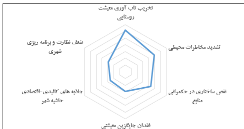
شکل (۲): رتبه‌بندی عوامل موثر در تحولات کالبدی مهاجرت در حاشیه شهر زنجان، منبع: نگارندگان، ۱۴۰۴