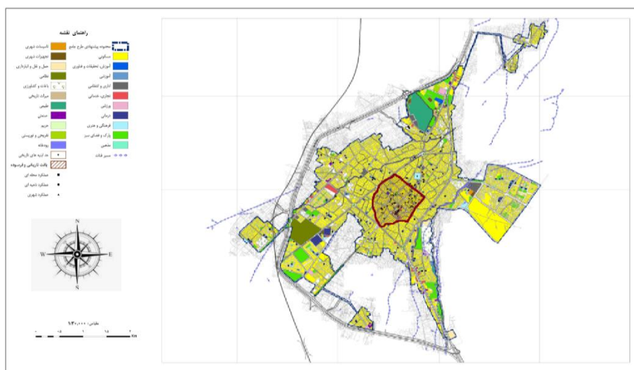
شکل ۲. کاربری اراضی شهرضا و محدوده بافت فرسوده