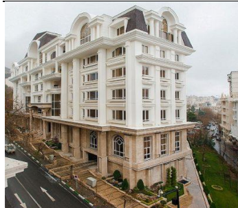
بام البرز سال ساخت: ۱۳۹۰ مشخصات نما: سرستون ساده، فرم پنجره قوس دار ساده، طرح نوارهای افقی، بالکن، احجام هرمی شکل قوس، احجام پیش آمده افقی، دارای ستوری و سرایی ورودی، با نمای سنگ گرانیت و سیمان