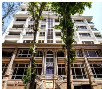
بام مهماندوست سال ساخت: ۱۳۸۷ مشخصات نما: سرستون ساده، فرم پنجره قوس دار ساده، طرح نوارهای افقی، بالکن، احجام هرمی شکل قوس، با نمای سنگ گرانیت و سیمان