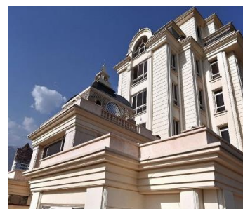
چناران پارک سال ساخت: ۱۳۹۰ مشخصات نما: سرستون کورنتی، فرم پنجره قوس دار ساده، طرح نوارهای افقی، بالکن، احجام هرمی شکل قوس، احجام پیشامده افقی، سرای ورودی، نمای سنگ گرانیت و سیمان