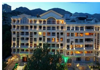
بام ناوران سال ساخت: ۱۳۸۷ مشخصات نما: سرستون کورنتی، فرم پنجره مدرن ساده، دارای سرایی ورودی با نمای سنگ گرانیت و سیمان