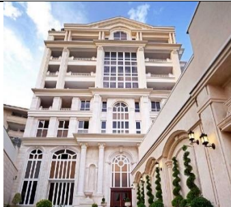
بام جمشیدیه سال ساخت: ۱۳۹۰ مشخصات نما: سرستون کورنتی، فرم پنجره قوس دار ساده، طرح نوارهای افقی، بالکن، احجام هرمی شکل قوس، نمای سنگ گرانیت و سیمان