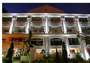
رز گاردن سال ساخت: ۱۳۸۹ مشخصات نما: فرم پنجره قوس دار ساده، دارای ستوری و سرایی ورودی، دارای نرده، با نمای سنگ گرانیت و سیمان