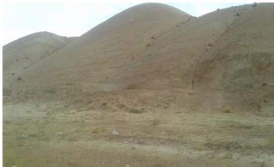
شکل ۶. گنبدهای نمکی روستای وزیری